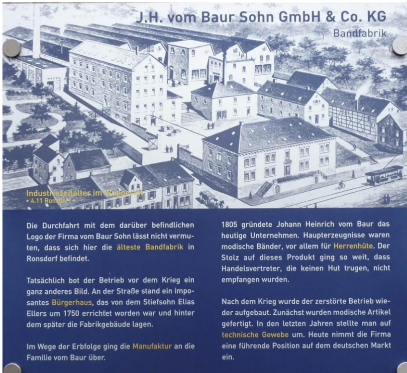
Informationstafel „Fäden, Farben, Wasser, Dampf – Industriegeschichte im Wuppertal Route 4 - Ronsdorf

Aber auch das Inlandgeschäft wurde von ihm nicht vernachlässigt. Der Zweite Weltkrieg (1939-45) brachte eine Vielzahl von Wehrmarchtaufträgen, so dass zeitweise in drei Schichten gearbeitet werden musste. Das alles ging beim Luftangriff in der Nacht vom 29. zum 30. Mai 1943 jäh zu Ende. Was mehrere Generationen aufgebaut hatten wurde in kürzester Zeit von den Bomben zerstört. Lediglich der Keller des Bürogebäudes blieb erhalten. Doch Hinnerk vom Baur gab nicht auf. Schon bald wurde auf dem Kellergeschoss eine Baracke errichtet, wo Geschäftsleitung und Verwaltung Platz fanden. Um die Produktion teilweise wieder aufnehmen zu können mietete er Sheds von Bandwirkern an, die zurzeit im Kriegsdienst waren. Da die Hausbandwirkerei in Ronsdorf fast zum Erliegen gekommen war wurden weitere Aufträge an Hausbandwirker im oberbergischen Raum vergeben. Mühsam musste das Rohmaterial dorthin geliefert und die Fertigung abgeholt werden. Erst nach der Währungsreform im Jahre 1948 konnte mit dem Wiederaufbau des Betriebes begonnen werden. Als erstes