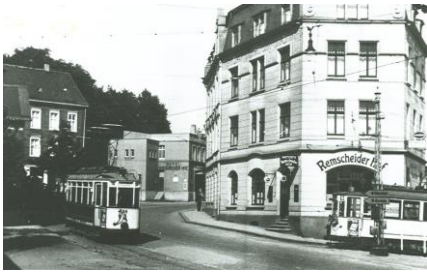
Straßenbahnen an der Gleisschleife Remscheider Str./Am Stadtbahnhof