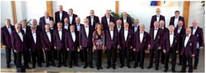
Chor BTV Graben

Ausrichter: Evangelische Altenhilfe Ronsdorf