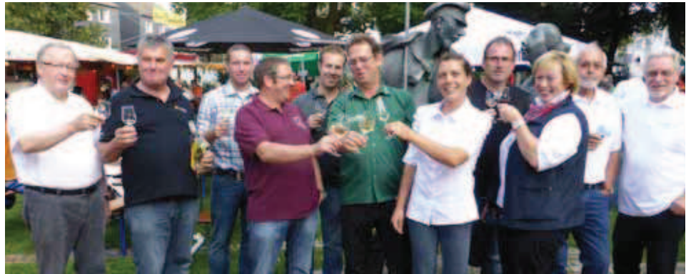
Die Premiere des Ronsdorfer Weinfestes 2015 hinterließ nur strahlende Gesichter und geschmacksfreudige Besucher.

Das mit 26.500 Hektar größte Weinanbaugebiet Deutschlands ist Rheinhessen und liegt im Bundesland Rheinland-Pfalz. Es umgibt die Städte Mainz, Worms, Alzey und Bingen. Während der letzten zwei Jahrzehnte erlebte besonders dieses Weinland einen enormen Aufstieg.