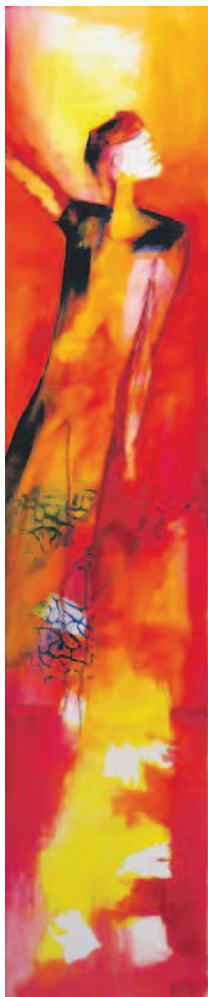
Ein Bild in leuchtenden Farben.