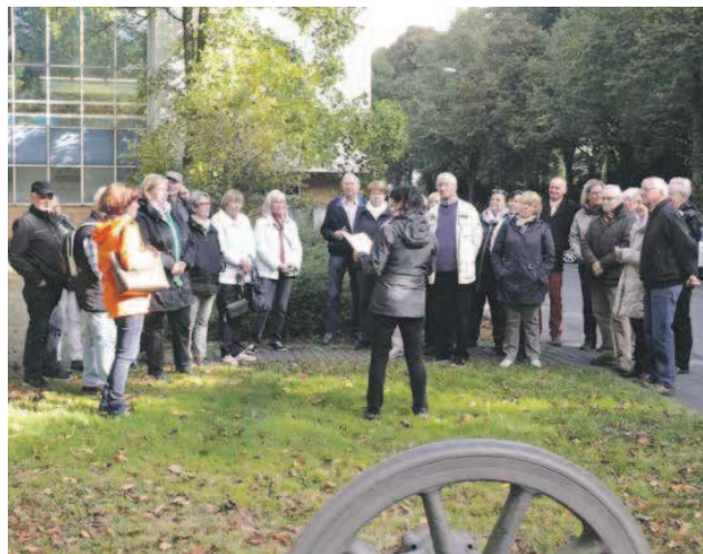
Die kulinarischen Wanderer trafen sich an der Gedenktafel der Ronsdorf-Müngstener-Eisenbahn.