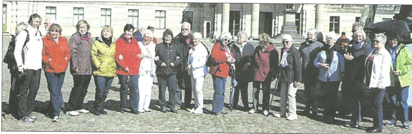
Die Reisegruppe des Heimat- und Bürgervereins besuchte die Partnerstadt Schwerin.

Reisegruppe aus Ronsdorf bei Empfang im Rathaus der Partnerstadt